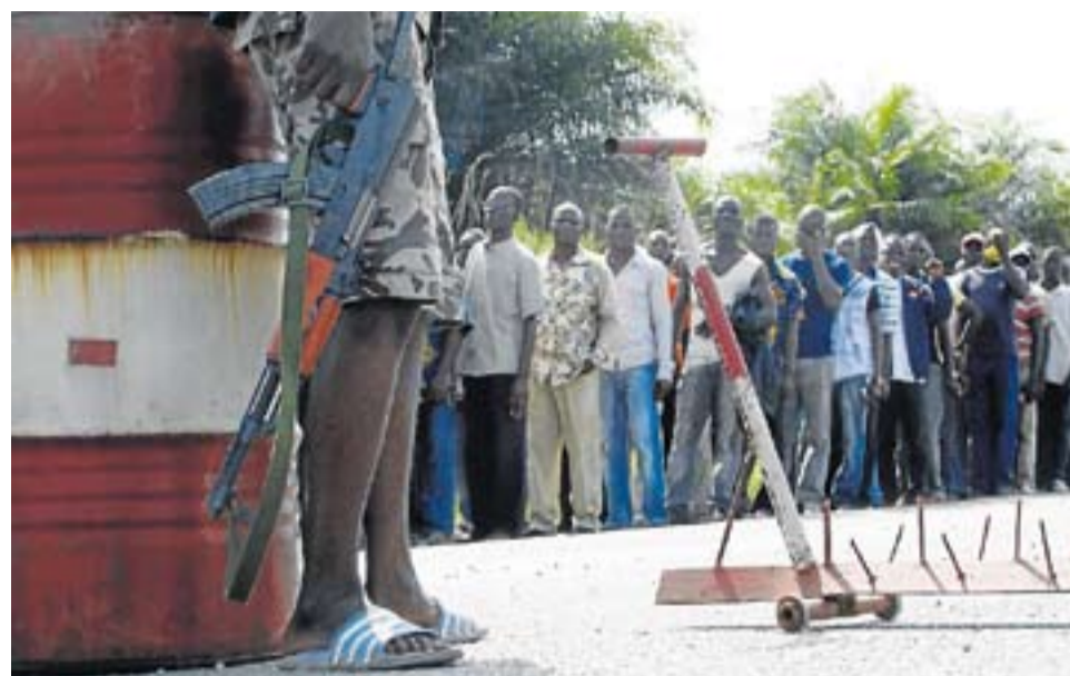
Los marfileños deben pasar los controles para salir y entrar de Abiyán.

La Organización Internacional del Cacao prevé una "cosecha abundante" en Costa de Marfil hasta febrero de 2011, con un gran stock por recolocar.