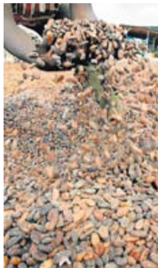
Habas de cacao.

Unos 14 millones de trabajadores dependientes