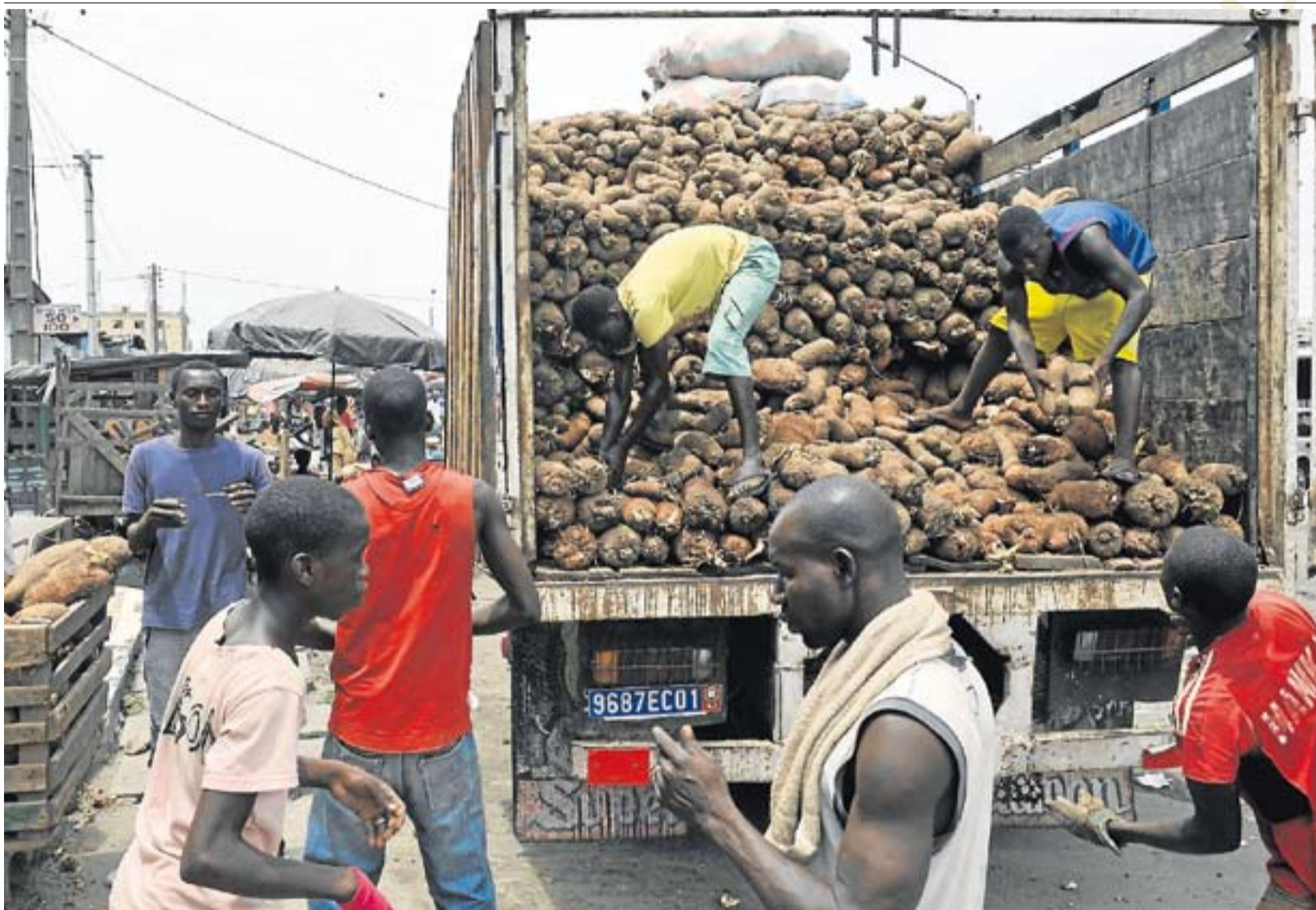
Varios hombres descargan un camión de cacao en un mercado de Abiyán, capital económica de Costa de Marfil.

ter en la cárcel en 2007 a varios empresarios, y al intentar nacionalizar la producción y el comercio a partir de 2009, Gbagbo firmó su propia sentencia de muerte. El resto de crímenes la comunidad internacional se los habría perdonado, como ya está perdonando a Ouattara la matanza de unos 800 civiles en Duekoué (oeste). Pero ese otro crimen, el de intentar apropiarse del cacao marfileño, Gbagbo lo pagará caro.