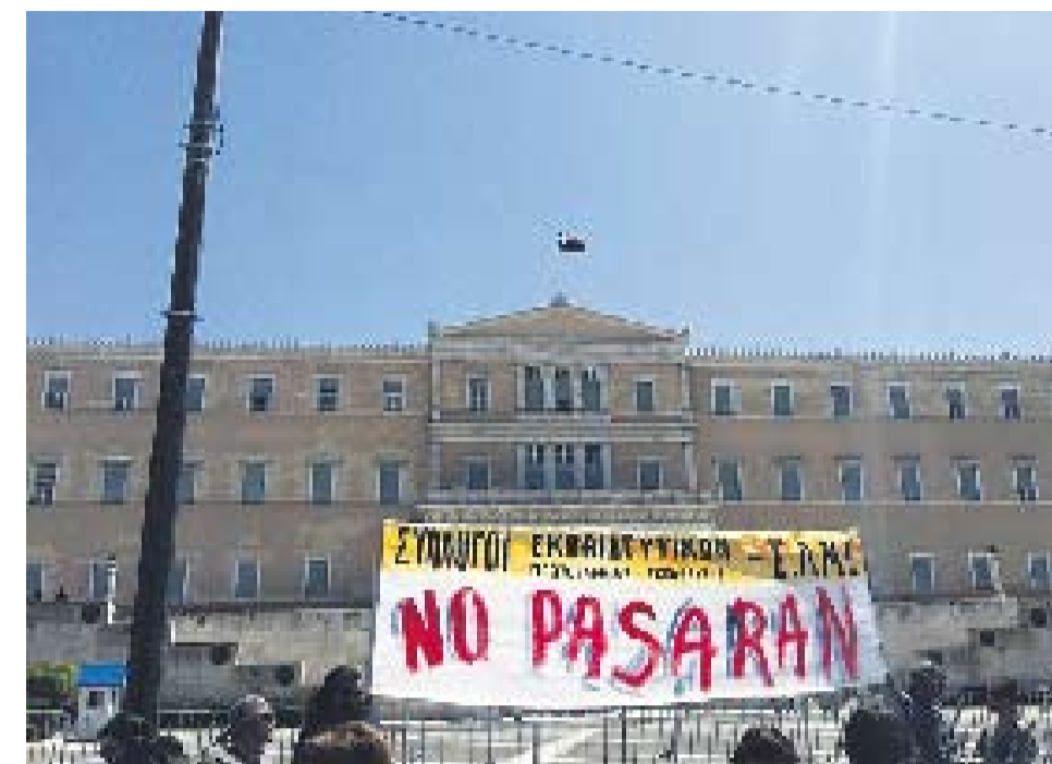
Una pancarta reza “No Pasarán” ante el Parlamento griego, en Atenas.

Nada es rosa ni paradisiaco en la Francia de la era Sarkozy. Pero las defensas clásicas de este pueblo funcionan mejor que lo ocurrido en otras latitudes. Así las cosas, los franceses no tenían ninguna razón de peso para abandonar su forma de movilización tradicional y abrazar la #spanishrevolution#. Al contrario, la indignación global funciona en Londres, EEUU, España o Israel. Es decir; viene a suplir la movilización clásica en países donde esta había desaparecido desde hacía décadas. Cosa que no es el caso de Francia. ●